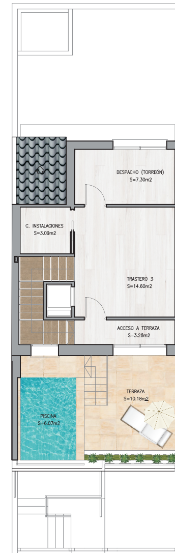
PLANTA TORREÓN / BAJO CUBIERTA